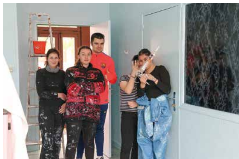
Des chantiers pour découvrir le monde du travail