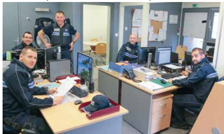
Les actuels locaux de la Police municipale

Le conseil municipal a autorisé le maire à déposer un permis de construire relatif à l'extension rénovation des actuels locaux de la police municipale. Cette modification, d'une centaine de m 2 , accolée aux actuels bureaux occupés par les agents de police sera située sur l'ancien terrain de boules accolé au bâtiment. Elle permettra non seulement de rendre plus accessible et plus visible ce service municipal mais aussi d'accueillir dans de meilleures conditions de confort et de sécurité les policiers de la ville et les usagers. En effet, cet équipement situé à l'arrière de l'hôtel de Ville juste au dessus du RCCN est devenu trop exigu pour accueillir la police pluricommunale qui compte désormais huit agents. Ce bâtiment offrira un véritable accueil pour le public mais aussi deux vestiaires, un "open space" et des bureaux sécurisés pour pouvoir recevoir notamment les serveurs nécessaires au bon fonctionnement de la vidéoprotection en cours de déploiement à Saint-Égrève.