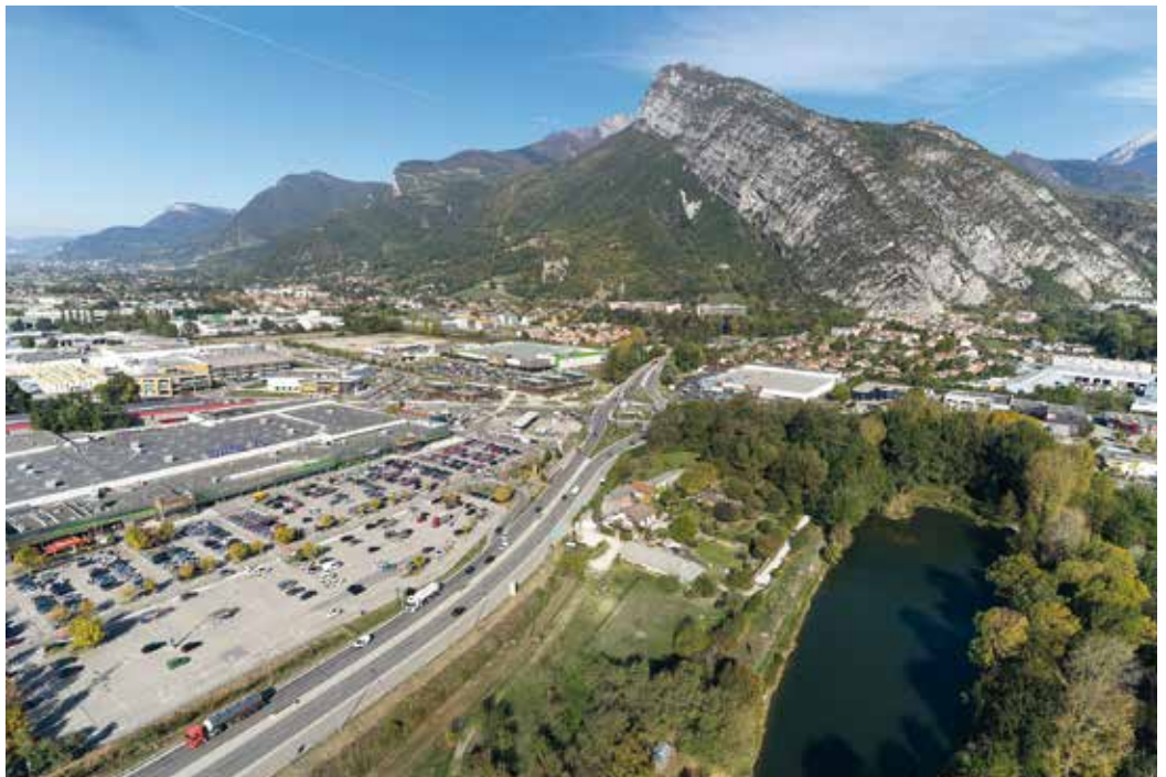
La qualité des entrées de ville et des zones commerciales comme Cap'38 au cœur du RLPi

Juridiquement, le RLPi est un document d'urbanisme qui fixe, par zones, les obligations en matière de publicité, d'enseignes et préenseignes. Il permet d'ajuster ou de préciser la réglementation nationale aux enjeux paysagers, touristiques, patrimoniaux et économiques de chaque territoire. Dans ce document, un équilibre doit notamment être trouvé entre protection du cadre de vie et communication des acteurs économiques. Si 15 communes métropolitaines sont déjà dotées d'un règlement local de publicité, Saint-Egrève fait figure de précurseur en la matière puisque la Ville a pour sa part adopté il y a 18 ans un RLP inter-