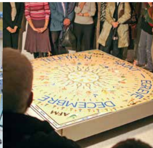
A la piscine ou à l'ERF, tout le monde répond "présent" à l'appel du Téléthon (archives)