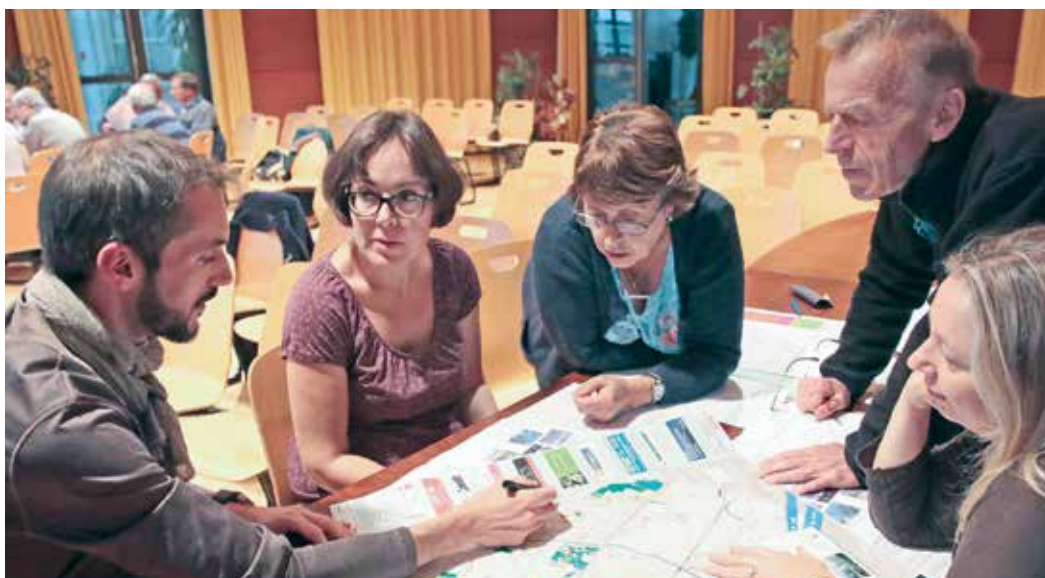
Séance de travail avec les conseils des habitants

Afin de maintenir un lien régulier avec les membres des Conseils des habitants et suite notamment aux discussions menées lors de l'évaluation des instances, il a été décidé la