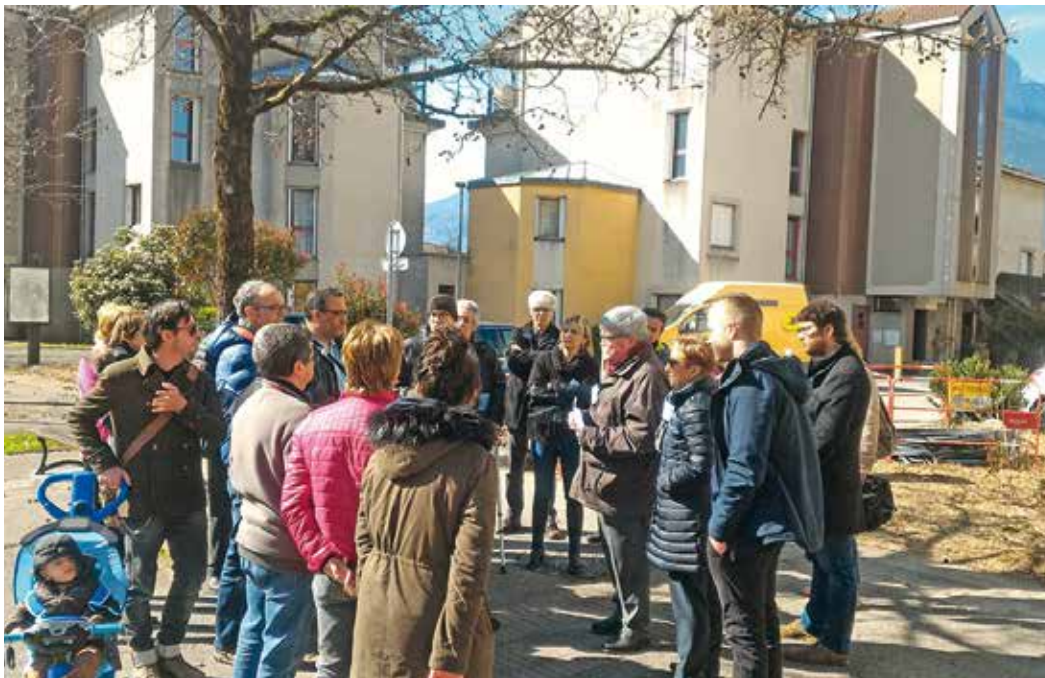
Edition 2018 des visites de terrain dans le cadre de “Notre quartier, parlons-en !”

Lancé en 2012 et reconduit en 2014, le dispositif “Notre quartier, parlons en !” a été conçu comme un “facilitateur de dialogue”. Il permet aux habitants de parler de leur quartier avec leurs élus à l’occasion de déambulations sur le terrain. Ces visites de terrain sont ensuite systématiquement complétées par une réunion de synthèse relative au secteur concerné. Elles