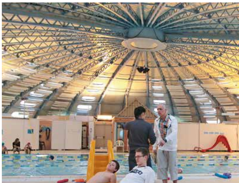
La toiture de la piscine va être réparée

A l'occasion du vote des nouveaux tarifs des piscines intercommunales lors du dernier conseil municipal, il a été annoncé que des gonflements au niveau de la toiture de la piscine Tournesol avaient été constatés lors d'une expertise menée sur le bâtiment. Pour y remédier au plus tôt, des travaux réparatoires seront donc menés durant trois semaines à compter du 17 ou du 24 juillet. Le temps de ce chantier, la piscine sera donc fermée et le restera ensuite pour la vidange annuelle.