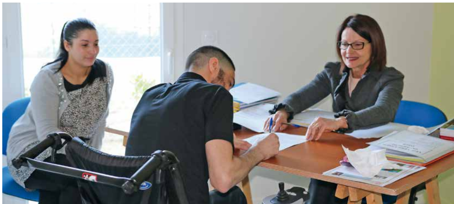
Signature de bail pour un logement aidé (archive)

Dans le cadre du Plan Partenarial de Gestion de la Demande (PPGD) métropolitain de logement social, le Conseil municipal a autorisé le Maire à signer le "protocole expérimental de location active". Ce dispositif a pour objectif de permettre qu'une offre attractive et valorisant le logement social soit mise en ligne pour équilibrer les pratiques de commercialisation des logements lorsque ceux-ci trouvent difficilement preneurs. Ce protocole, qui devra rapidement être mis en place permettra de simplifier les démarches du demandeur de logement social, concernera l'ensemble du