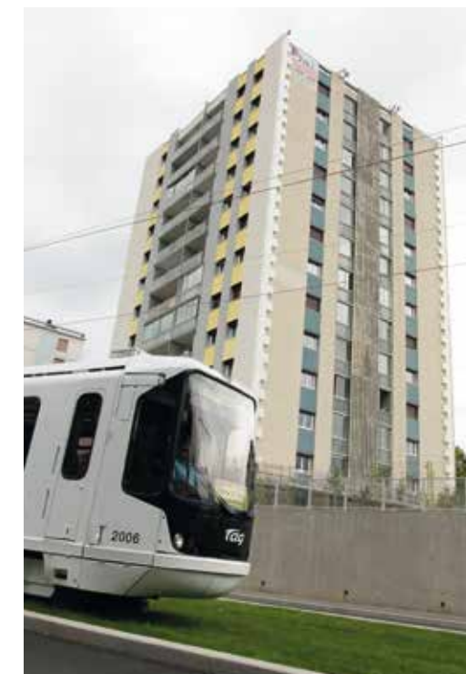
Participation à Mur Mur

Par ailleurs et toujours sur le site internet municipal, les groupes politiques disposent également d'un espace d'expression politique à la rubrique "Mairie".