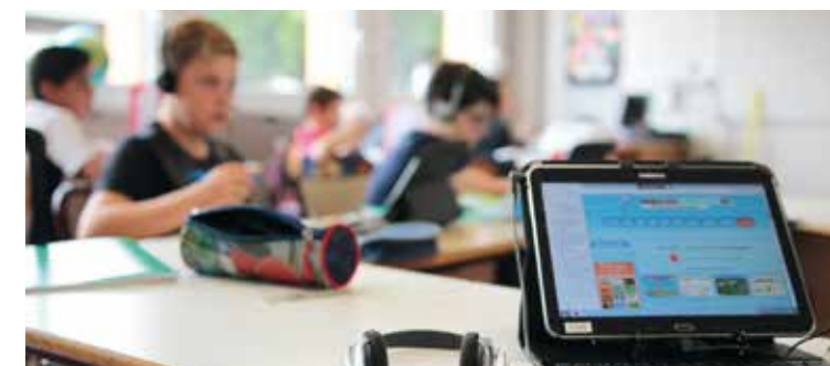
Plan numérique à l'école