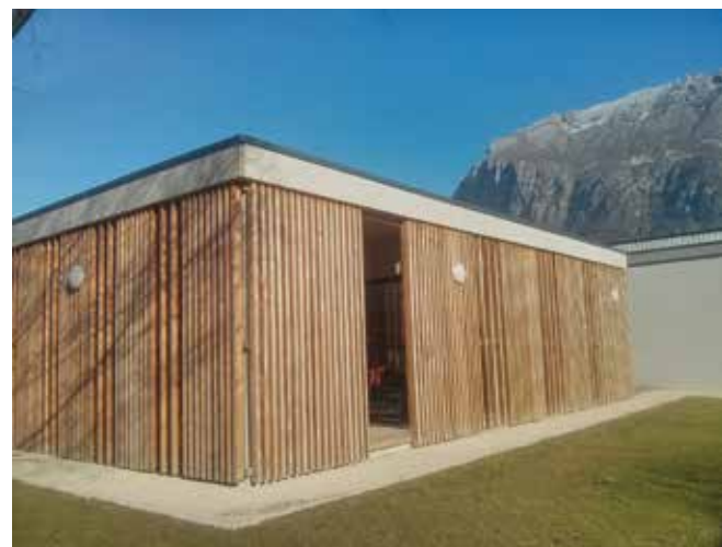
Rénovation du centre technique