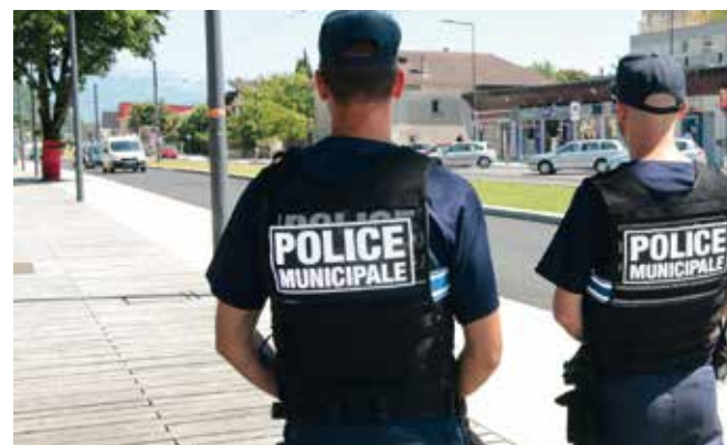
Des efforts pour la tranquillité publique