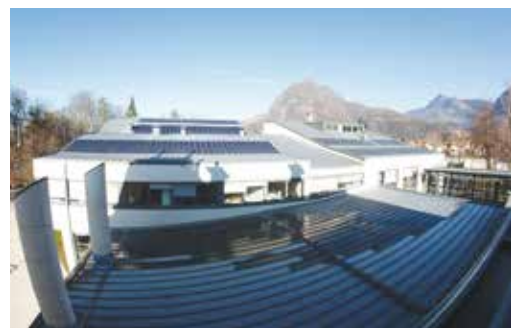
3 centrales photovoltaïque produisent l'équivalent 2,5% de la consommation d'électricité de la ville

Lors du conseil municipal du 8 juillet dernier, La Ville a décidé de s'engager une fois de plus aux côtés de la Métropole pour le nouveau plan air-énergie climat 2015-2020. Celui-ci a pour objectif de "mobiliser et de structurer l'action des collectivités face au défi du changement climatique". Il regroupe donc l'ensemble des mesures à prendre pour réduire les émissions de gaz à effet de serre. Ce plan fixe des objectifs chiffrés