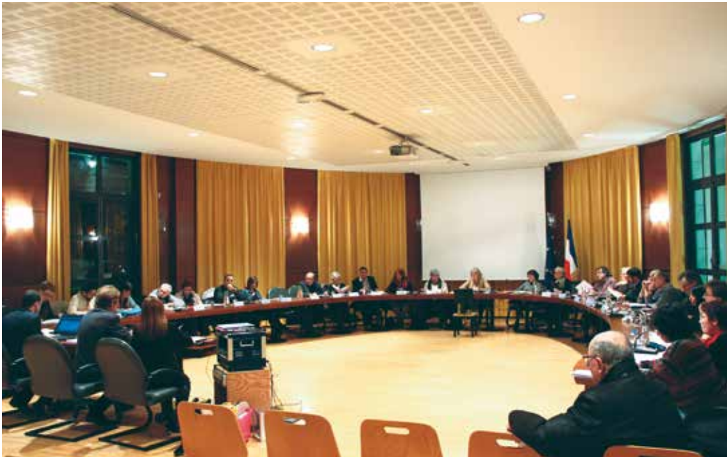
Une séance du Conseil municipal

Le Conseil municipal représente les habitants. La Saint-Egrève 33 élus y siègent et s'y répartissent en quatre groupes. Si le groupe majoritaire compte 26 conseillers municipaux, les trois autres groupes d'opposition rassemblent respectivement 3, 3 et 1 personnes. Ses attributions sont très larges puisqu'il règle "par ses délibérations les affaires de la commune". Cela signifie entre autre qu'il émet des vœux sur tous les sujets d'intérêt local, qu'il vote le budget prévisionnel puis approuve le compte administratif. Il est aussi compétent pour créer et supprimer des services publics municipaux, pour décider des travaux, pour gérer le patrimoine communal, pour accorder des aides... De l'État civil à l'urbanisme en passant par la police, la culture ou la solidarité, l'action d'une