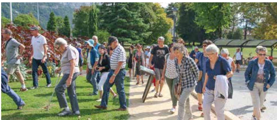
Découvertes des panneaux patrimoniaux lors des journées du patrimoine

Séduit par l'installation des bornes patrimoniales à travers les rues de la commune, l'office du tourisme métropolitain a décidé d'intégrer celles-ci à la nouvelle édition de son guide. Ainsi, les responsables de cette publication, qui propose de découvrir les richesses de l'agglomération, se sont rapprochés de la mairie et de l'association Histoire et Patrimoine Vence Cornillon. Résultat, dès le mois de janvier prochain, une partie de l'histoire de la commune sera présentée lors de visites guidées proposées par un guide de l'office du tourisme métropolitain. Affaire à suivre... ■