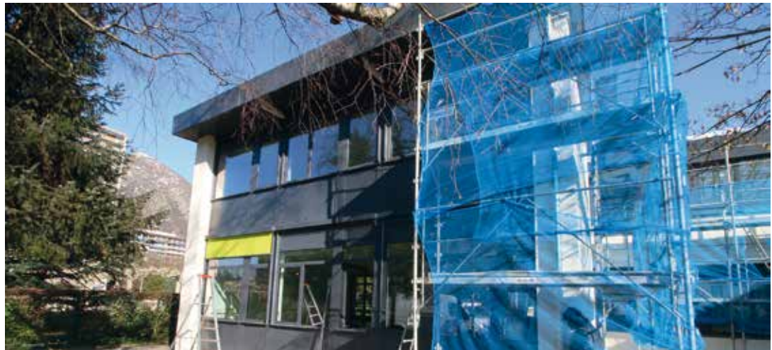
Travaux de rénovation énergétique à l'école Barnave

Ainsi à titre d'exemple la consommation globale de gaz naturel est passée de 5 086 857 kWh/an en 2013 à 3 453 368 kWh/an en 2018. Moins marquée pour l'eau, dont la consommation est directement liée au niveau des