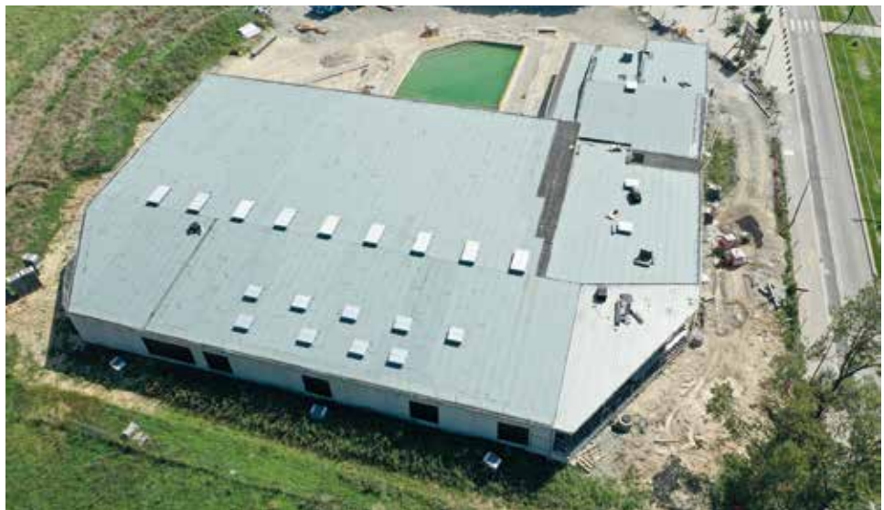
La toiture de la piscine intercommunale sera végétalisée

Moins visibles depuis qu'ils se concentrent sur les aménagements intérieurs, les travaux de la future piscine intercommunale se poursuivent. Si le toit est quasiment terminé (notre photo), il reste encore aux équipes à installer toutes les menuiseries aluminium pour mettre le bâtiment hors d'eau et hors d'air. Une fois toutes les portes et fenêtres posées, le chantier pourra donc se concentrer sur le second œuvre ce qui est loin d'être une mince affaire tant les spécificités techniques d'un tel équipement sont nombreuses. Électricité, chauffage mais aussi systèmes de filtration de l'eau, isolation... ne sont que quelques-uns des défis que doivent encore relever les ouvriers. Pour mémoire, coiffée d'une toiture végétalisée la piscine intercommunale proposera un espace couvert d'une surface de plancher de 2 487 m 2 environ dans lequel on retrouvera notamment un bassin sportif de 375 m 2 , un bassin destiné à la récupération, l'apprentissage et l'aquagym