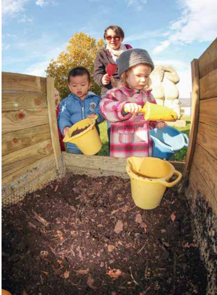
Compostage collectif à la MSF (archive)