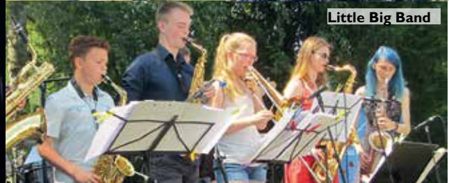
Little Big Band