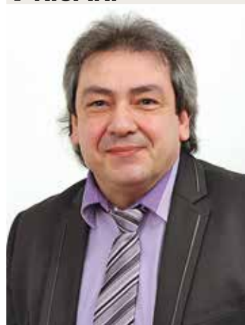
Adjoint en charge de l'action éducative