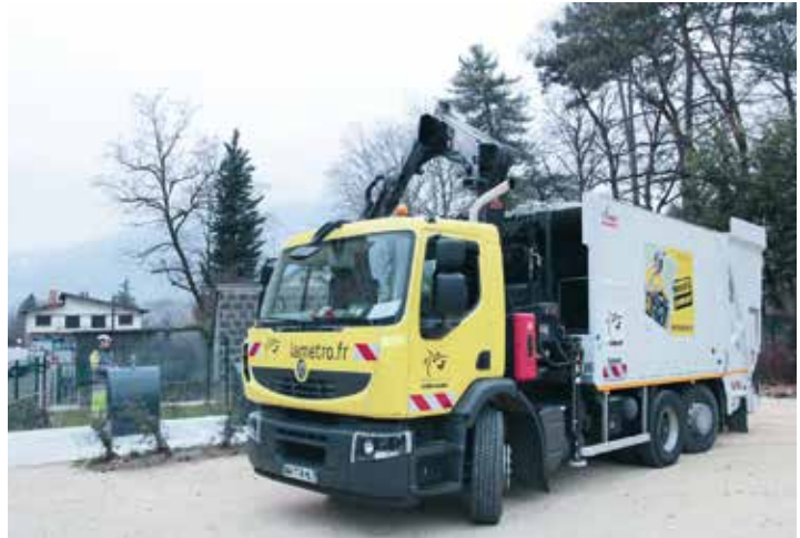
Depuis 2005 c'est la Métro qui assure la collecte des déchets ménagers

réduire de moitié la poubelle des ordures ménagères et de recycler deux-tiers des déchets. Dès janvier, trois quartiers (le centre-ville et la Capuche à Grenoble, et la Commanderie à Échirolles) expérimenteront le tri des déchets alimentaires. Un dispositif qui sera étendu à l'ensemble des 49 communes, (dont Saint-Egrève) à partir de 2019 et qui sera renforcé par une tarification incitative et un contrôle du tri renforcé... Affaire à suivre. ■