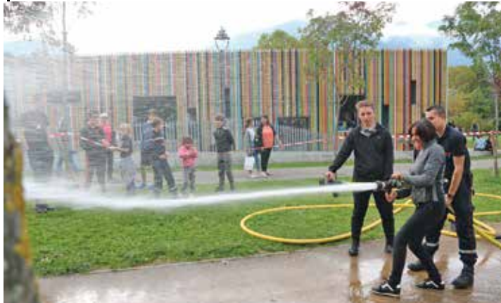
Au Pôle Jeunesse, on n'hésite pas à se mouiller pour assurer l'animation !