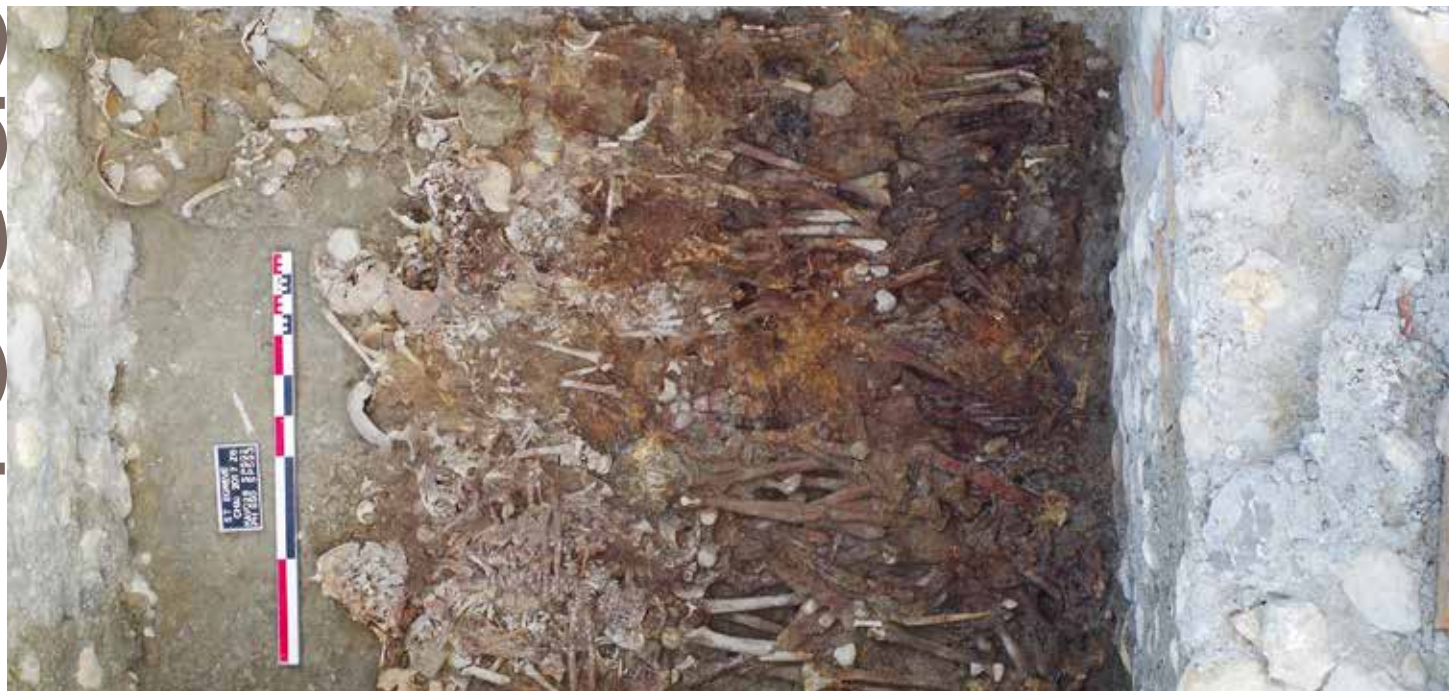
Vue zénithale du caveau nord-ouest de l'église prieurale