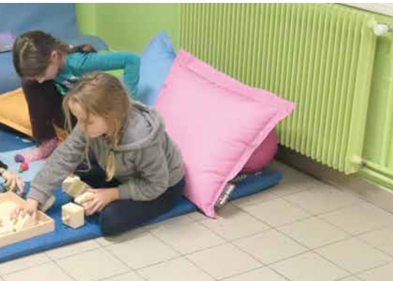
Zone calme dans un accueil périscolaire