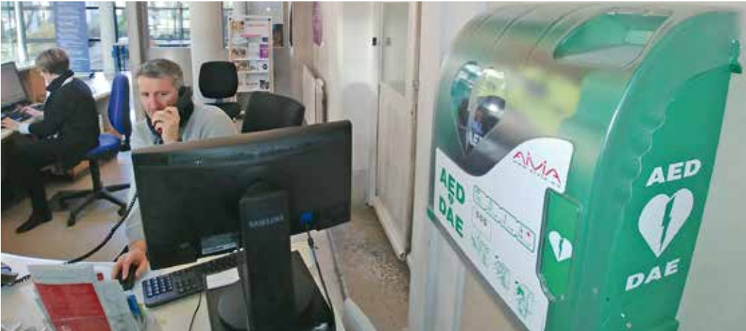
Des défibrillateurs semi-automatiques "au cas où"...

Afin d'offrir un maximum de sécurité et de participer à la prise en charge de certains malaises cardiaques, la Ville a investi dans 18 défibrillateurs qui ont été installés dans autant d'équipements municipaux. Le point sur la question.