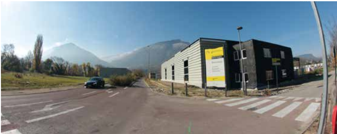
Le bâtiment MAPE RGA en phase de finalisation à Vence Ecoparc

Sur les 20 hectares de Vence Ecoparc, soit 200 000 m 2 , la zone d'activité métropolitaine dont l'aménagement a été lancé en mai 2010 à Saint-Egrève, 168 150 m 2 ont déjà été commercialisés. Ces parcelles aménagées reçoivent actuellement ou sont sur le point de recevoir 13 sociétés et Novaparc un village d'entreprises de 9 500 m 2 environ.