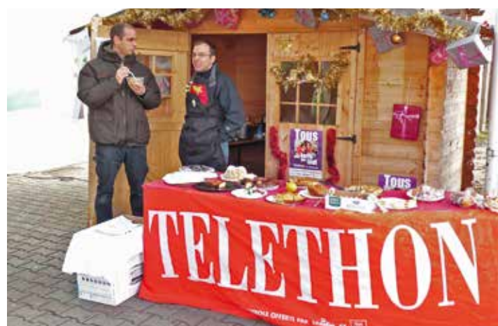
Mobilisation pour le Téléthon (archive)

Le dimanche 10 décembre, en partenariat avec l'Association Familiale, le Pôle Jeunesse et la Diagonale du Sou, l'USSE installe ses stands et autres animations à l'Espace Robert Fiat et alentours. Dans le parc de l'Hôtel de Ville, une chasse au trésor est proposée par l'USSE Course d'Orientation qui invite les bonnes volontés à parcourir le site pour y dénicher des décorations. La section athlétisme de l'USSE a tracé un trajet et invite les plus sportifs à parcourir un maximum de distance, en