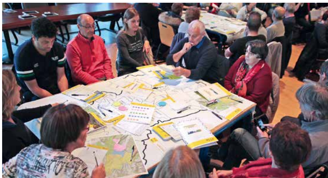
Le premier atelier territorial a été organisé à Saint-Egrève

Habiter, travailler, se déplacer... Par ces actions quotidiennes chacun est concerné par le fonctionnement du territoire. C'est pour coordonner ce four-