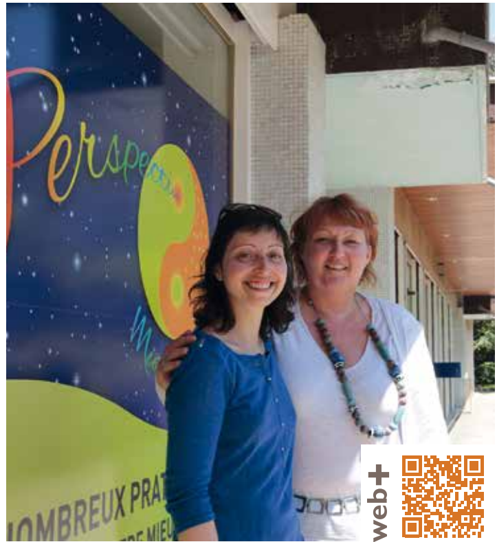
Perspective mieux-être propose aussi de louer son local aux particuliers pour les soirs ou les week-end