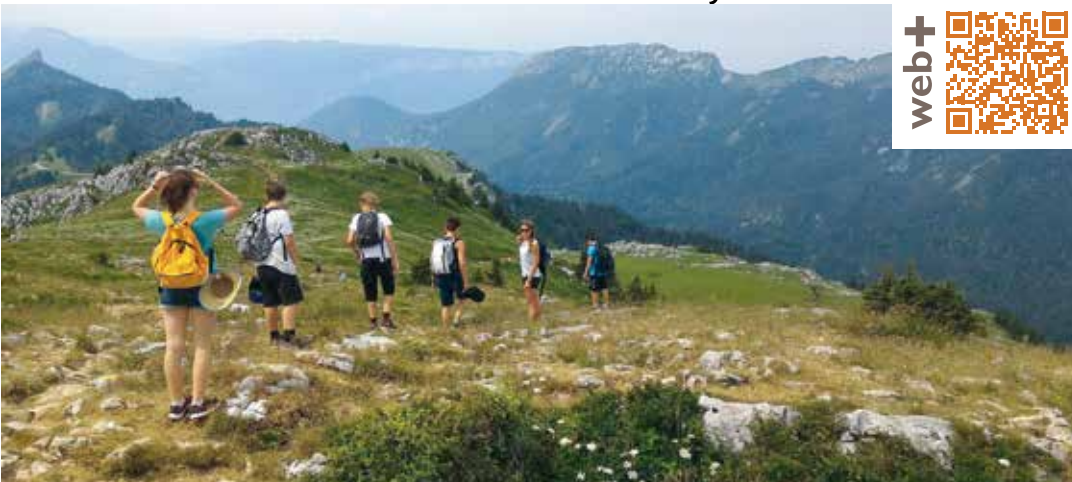
Partir à l'aventure avec le Pôle jeunesse

Quand on est jeune, qu'on a la vie devant soi et que vient l'été on se sent pousser des ailes. Pour faire de cette saison une épopée épique et se forger des vacances en or pas d'hésitation : il faut foncer au Pôle jeunesse. Si les séjours estivaux que propose l'équipe sont déjà bien remplis, il est encore temps de s'inscrire à l'une des 29 sorties à la journée organisées en juillet et en