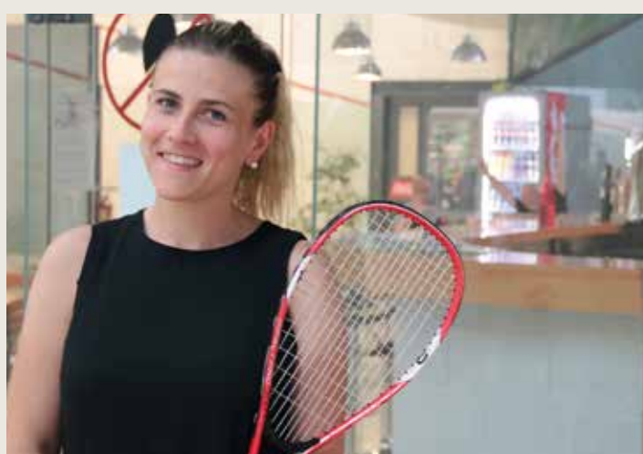
En savoir + : 09 86 35 80 81 ou http://www.squash-team.fr/

PLAN CANICULE : le CCAS propose un dispositif de soutien à destination des personnes les plus fragiles afin de réduire le risque d’accidents liés aux fortes chaleurs. Afin de bénéficier des visites régulières des agents de la ville lors des épisodes caniculaires les inscriptions se font au 04 76 56 53 47