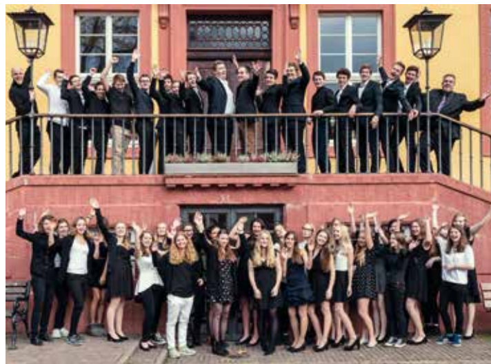
Splendid ! Le Grand orchestre de Karben