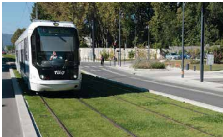
Le PDU où comment bien se déplacer dans l'agglomération

I maginer la mobilité de demain, améliorer les déplacements de chacun et favoriser l'usage des modes de déplacement alternatifs à la voiture individuelle. Tel est l'objectif de la réflexion menée autour du futur Plan de Déplacement Urbain (PDU) en cours d'élaboration. Il est d'ailleurs toujours possible de participer à la concertation en ligne jusqu'au 11 juin.