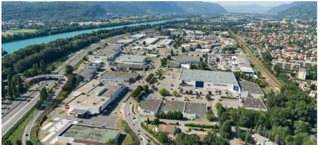
Les zones d'activités ne seront plus éclairées pour rien entre 1h et 5h du matin