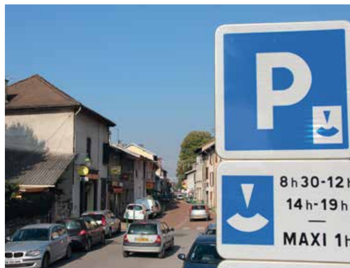
A Saint-Egrève les zones bleues sont entrées dans les mœurs

A noter : la liste exhaustive de ces secteurs est disponible sur www.saint-egreve.fr .