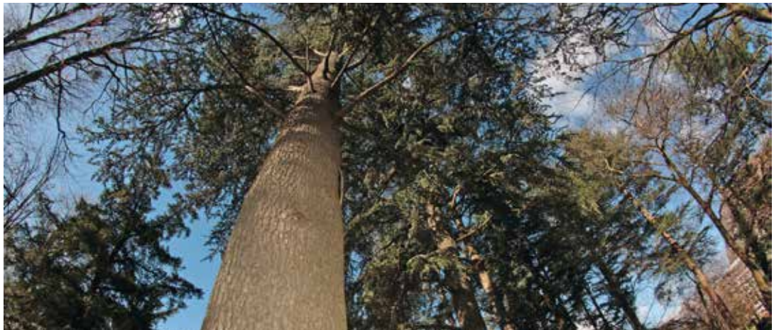
Saint-Egrève entretient et développe son patrimoine arboré

Grands ou petits, en ornement ou en bosquet, les arbres à Saint-Egrève occupent une place d'honneur dans l'espace public. En début de mandat, la Ville avait annoncé la plantation de 1000 nouveaux sujets. Où en est-on ?