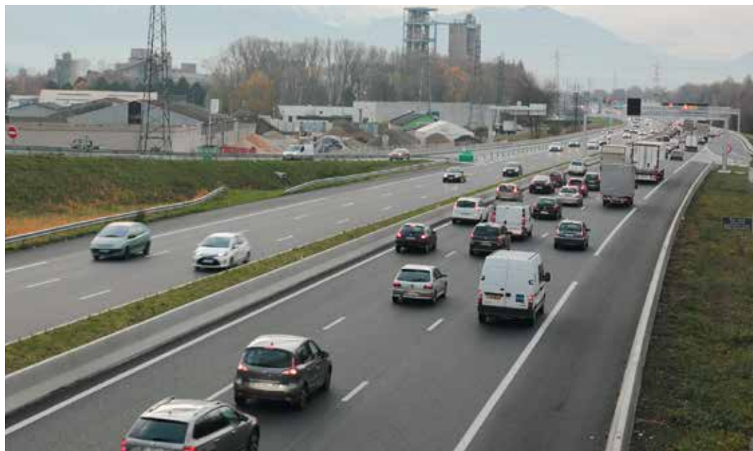
Les mesures de restriction de la circulation lors des pics de pollution sont adossées aux certificats Crit'air

Depuis sa mise en place en novembre dernier, le dispositif métropolitain de réponse graduée aux épisodes de pollution de La Métropole, a été déclenché trois fois lors d'épisodes météorologiques propices à l'augmentation du taux de particules fines dans l'atmosphère locale. Durant ces périodes, des régulations de la circulation automobile ont été