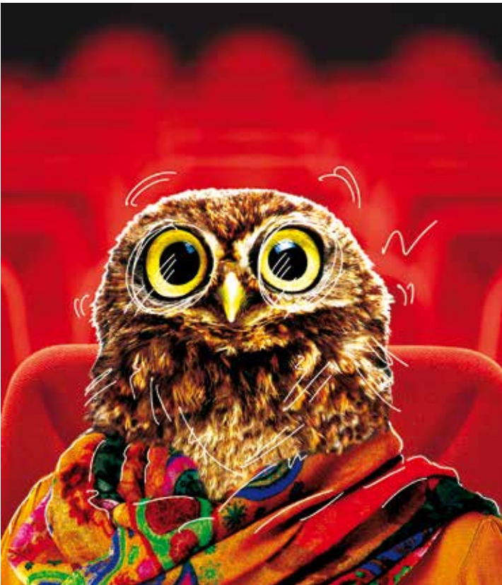
Chouette ! A vous de Voir revient à La Vence Scène

Avis aux cinéphiles, la grosse voix des bandes annonces le clame dès à présent: “Du 17 au 22 février, les rencontres cinématographiques de Saint-Egrève reviennent à La Vence Scène pour une deuxième édition encore plus énorme”.