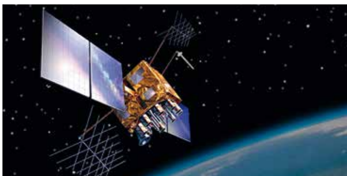
Des satellites pour surveiller les arbres saint-égrévois

A Saint-Egrève, sur les quelques 3900 arbres recensés qui poussent sur l'espace public, 1992 ont été dûment identifiés lors d'un diagnostic réalisé par le bureau d'études CITARE en 2014 et 2015 dans les parcs publics ou sur la voirie. Ce travail a été fait en collaboration avec le système d'information géographique (SIG) de la Ville dont les techniciens peuvent désormais s'appuyer sur les systèmes de positionnement satellitaires des GPS afin de géolocaliser très précisément sur une carte chaque arbre que compte Saint-Egrève. "Ils sont tous identifiés. Chaque sujet