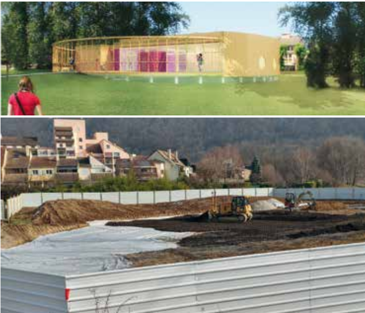
Les travaux de terrassement (en bas) du Pôle enfance (en haut) ont débuté

Ça y est, les travaux du Pôle Enfance de Fiancéy ont été lancés. Mi-janvier, les engins de terrassement ont en effet commencé à préparer le terrain sur lequel sera érigé un bâtiment original centralisant un Etablissement d'Accueil du Jeune Enfant (EAJE) collectif de 40 places mais aussi une ludothèque associative et le Relais d'Assistants Maternelles (RAM). Si en ce moment, c'est surtout le terrain qui est au cœur des attentions, la construction du bâtiment en lui-même va prochainement être lancée. Les fondations sur lesquelles reposeront les pilotis de cet équipement en bois aux