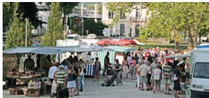
Depuis son inauguration en septembre 2009 (notre photo) le marché Marius Camet attire les Saint-Egrévois

Depuis le mois de septembre 2009, les commerçants du marché de fin de journée installent leur stand sur l'ancien terrain de basket transformé en parking qui jouxte l'allée cavalière qui relie la RD 1075 au château Borel. Toutefois, avec la réhabilitation de celle-ci et les travaux d'embellissement du parc Marius Camet (voir aussi en page 9), il va falloir changer un peu ses habitudes. En effet, le 23 février les commerçants vont déménager pour prendre place... sur l'allée cavalière elle-même, à deux pas de leur localisation actuelle. En effet, cette perspective entièrement rénovée et rendue aux piétons a été spécialement aménagée afin de pouvoir recevoir dans les meilleures conditions les étals des commerçants et leurs clients! Une fois ce déménagement fait, les services de la Ville pourront "déposer" l'ancien parking et le transformer en espace vert. ■