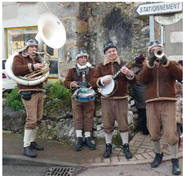
Tombola et animations de proximité, les commerces font les fêtes (archive)

Pendant le mois de décembre, les marchés aussi sont à la fête et les commerçants non sédentaires ont pour leur part préparé quelques réjouissances. Ainsi, les clients pourront profiter d'animations variées et picorer quelques papillotes sur le marché du parc Marius Camet le jeudi 22 décembre, à Prédieu le vendredi 23 décembre et à La Monta le 24 décembre... ■