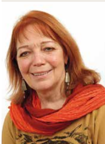
Adjointe déléguée à la solidarité entre tous les âges de la vie

Les efforts en direction des personnes âgées sont importants à Saint-Egrève. Pourquoi tant d'attentions ?