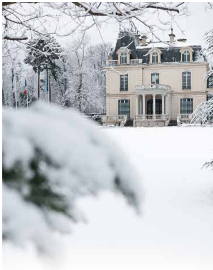
Pour déneiger les rues, la Ville dispose de 2 camions et de 2 tracteurs équipés de lames et de saieuses. Mais les parcs, on les aime bien comme ça...

nique peuvent être mobilisés dès 5 h du matin pour dégager les voiries de Saint-Egrève. Pour ce faire, ils suivent un itinéraire prioritaire qui comprend les rues empruntées par les transports en commun, par les services d'urgence, celles à forte pente, la Maison du lac, les places de marché, les pistes cyclables... Ce qui correspond à environ 70% du réseau communal et maille entièrement le territoire de Saint-Egrève. A cela s'ajoute un itinéraire secondaire correspondant au reste du réseau communal et qui est mis en œuvre lorsqu'il ne neige plus et que le plan prioritaire est terminé. Enfin, en semaine le déneigement manuel des itinéraires piétons est également organisé et six agents peuvent intervenir pour dégager les accès aux équipements publics. ■