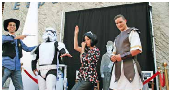
L'équipe du Patio prépare déjà ses déguisements

2016 n'a pas encore tiré sa révérence que le Pôle Jeunesse se prépare déjà à bien commencer 2017 avec une soirée déguisée d'anthologie. Les 12-17 ans (et seulement eux) sont invités samedi 7 janvier pour une "grosse grosse" soirée au Patio de 19h30 à 22h. Et niveau déguisement, il faudra assurer car si chaque participant doit bluffer les autres, il doit aussi être en mesure d'assurer sur le dancefloor auquel un DJ a pour mission de mettre le feu ! Attention cette soirée -dont la participation aux frais est de cinq euros- est exclusivement réservée aux Saint-Egrévois mais chaque jeune peut inviter une personne non saint-égrévoise dont il sera responsable. ■