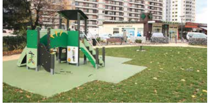
Le square va être sécurisé

Début décembre, la Ville va sécuriser le square de La Pinéa. En effet, afin que les petits utilisateurs de ces jeux publics (et leurs parents !) puissent en profiter en toute sérénité, l'espace va être entièrement ceinturé par une clôture et ne sera plus accessible que par un unique portillon. Profitant de ce petit chantier, une partie des parterres de ces jeux va être remplacée par un sol en stabilisé comparable à celui qui a déjà été installé à l'espace de jeu du domaine de La Monta. ■