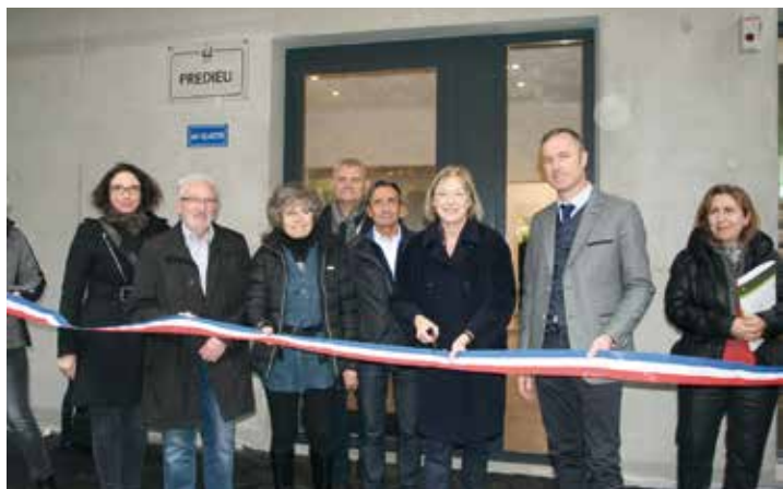
Les premiers appartements HSS ont été inaugurés

Vendredi 18 novembre dernier, c'est une résidence d'un nouveau genre qui a été inaugurée à Prédieu. A proximité du Square Armand Nordon, l'immeuble de la SDH dans lequel s'est récemment installée la pharmacie du secteur propose 14 logements dont cinq ont été labélisés “Habitat Seniors Services”. Ce label H.S.S.® est un outil au service d'une politique préventive. Il vise à préserver le plus longtemps possible l'autonomie de la personne âgée à son domicile. Il cible prioritairement des seniors autonomes auxquels il propose des adaptations techniques de leur logement, des parties communes de leur immeuble et de ses abords pour limiter notamment les risques de chute et les rendre accessibles. Il propose des services adaptés fournis soit par le bailleur comme la détection et le report des situations à risques ou encore un suivi personnalisé des interventions techniques. Il peut aussi faire intervenir des partenaires pour les soins à domicile, les services sociaux... ■