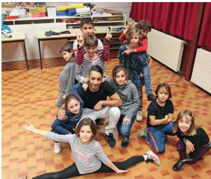
L'atelier hip hop de la MJC à Barnave : une nouveauté 2016

Nouveauté de cette année, l'atelier échecs de l'accueil périscolaire du Pont de Vence est avec le théâtre ou encore la danse hip hop à l'école de La Monta, une activité très appréciée des enfants. Elle s'inscrit dans le cadre d'une nouvelle organisation globale mise en place dans les six groupes scolaires publics de la ville depuis la rentrée de septembre. Organisation qui a été développée en concertation avec les familles et qui met l'accent sur les activités à dominante culturelle.