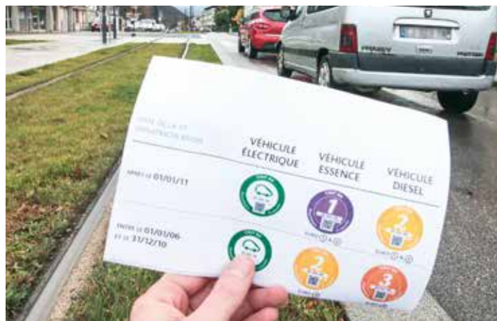
Les macarons "critères" pour lutter contre la pollution

Pour ce faire les véhicules à moteur doivent désormais arborer sur leur pare-brise un certificat de couleur allant du vert au noir qui sont délivrés