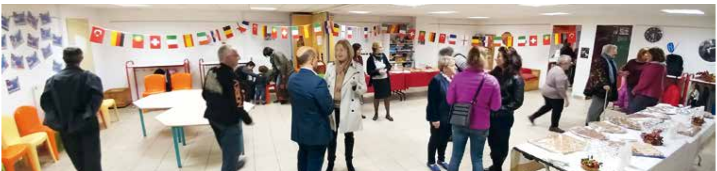
L'inauguration des travaux a été l'occasion de découvrir les nombreuses améliorations de l'Espace Europe

Parallèlement aux travaux menés dans l'Espace Europe (voir ci-contre), la Ville a en 2016 continué ses efforts en matière de mise en accessibilité de ses bâtiments publics. Ainsi, tout au long de l'année, de multiples chantiers de mise aux dernières normes ont été menés aussi bien au Conservatoire de musique L'Unisson, au Club House de Fiancey, ou encore au Centre de loisirs maternel Europe. A côté de ces "établissements recevant du public", des équipements extérieurs comme le plateau sportif du Pont de Vence, les sanitaires publics de Rochepleine ainsi que les parcs publics de Rochepleine, de Vence et des Buttes ont eux aussi été pris en charge dans le cadre de l'agenda d'accessibilité programmée de la Ville. En tout 28 ERP et 27 IOP sont inscrits dans cet Ad'AP qui doit se poursuivre jusqu'en 2021.