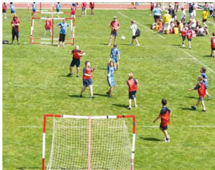
L’USSE compte 2700 adhérents... et vous?

Et puis, à 19h, une paëlla géante et un barbecue devraient permettre de prolonger cette première fête du sport jusqu’à tard dans la nuit. D’autant plus qu’un DJ devrait participer à réchauffer l’ambiance à grands coups de décibels! ■