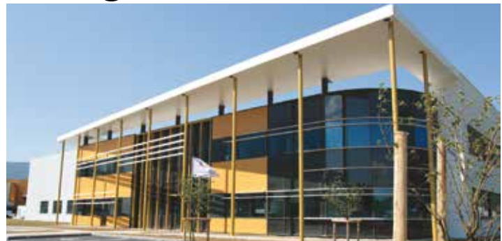
Jusqu'alors réparties sur deux sites, les équipes d'ARaymond Life ont intégré des locaux neufs rue L. Besançon à Saint-Egrève

Berceau historique d'ARaymond, qui fête ses 150 ans, le site de la région grenobloise est actuellement en pleine restructuration. En effet, jusqu'à présent dispersées entre Grenoble et les locaux historiques du Cours Berriat et à Technisud, c'est à Saint-Egrève que se concentrent depuis juillet 2014 toutes les activités locales de production métal, plastique, de recherche et les aménagements devraient se terminer cet été... Le siège social et un musée demeurent cours Berriat, tandis que le site de Technisud se concentre sur l'activité connectique des fluides de ARaymond. ■