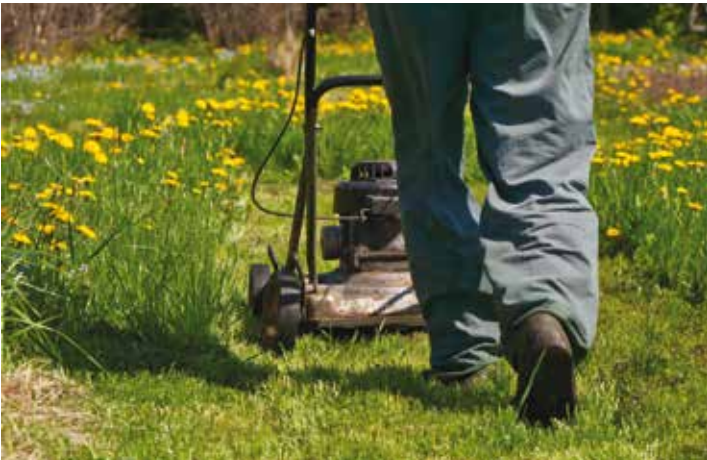
L'utilisation des engins à moteur est soumise à certaines règles

Si le cadre est effectivement essentiel, ce sont surtout les personnes qui l'habitent qui font d'une ville un endroit où il fait bon vivre. Alors, avec l'arrivée de l'été pourquoi ne pas réviser rapidement quelques règles essentielles de bon voisinage ?