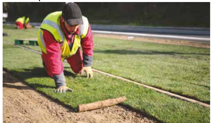
Le choix du gazon : la solution défendue par la Ville

La Ville de Saint-Egrève a naturellement pris part à la réalisation de la ligne E et n'a pas hésité à défendre bec et ongles certains points qui lui semblaient essentiels. En effet, alors que le projet initial prévoyait un tram roulant sur du béton, la commune a insisté pour que le terre-plein central de l'équipement soit entièrement "vert". Si dans un premier temps le SMTC a proposé de développer du sédum, une plante grasse, la Municipalité a défendu le choix plus esthétique du gazon pour participer à la qualité de ce projet.