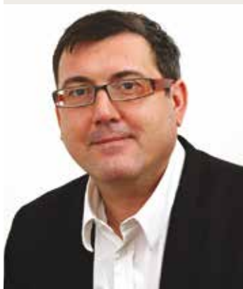
Adjoint en charge de l'urbanisme

Quel est selon vous le plus grand changement apporté à Saint-Egrève par la ligne E?