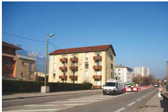
L'immeuble de logements à l'angle de la RD107

Ainsi, sur certains secteurs comme Prédieu ou la Trémouillière, le tram a été la clef de voûte des orientations d'aménagements du PLU de 2011. Il a été donc possible de prévoir des maillages des cheminements piétons et de faire en sorte que chaque projet immobilier prenne en compte l'organisation des déplacements et développe des espaces verts généreux et de qualité.