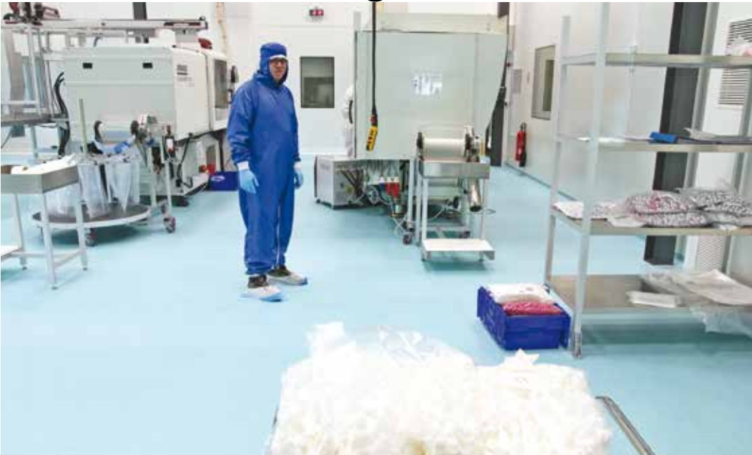
Un chef d'atelier en salle blanche chez ARaymondLife

Le 4 juin dernier, une inauguration officielle était organisée par ARaymondLife, la société pharmaceutique du Réseau ARaymond installée sur les anciens terrains de l'Etamat depuis fin 2014. Créée en 2007, ARaymondLife compte aujourd'hui 30 collaborateurs et se spécialise dans la plastur-