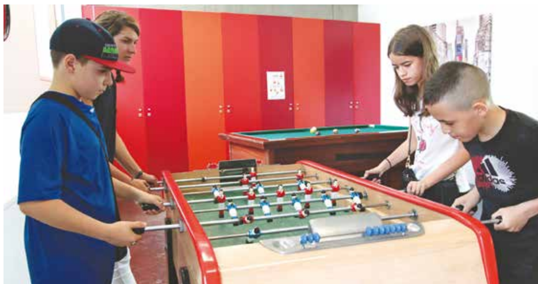
Au Patio, il y a tout ce qu'il faut !