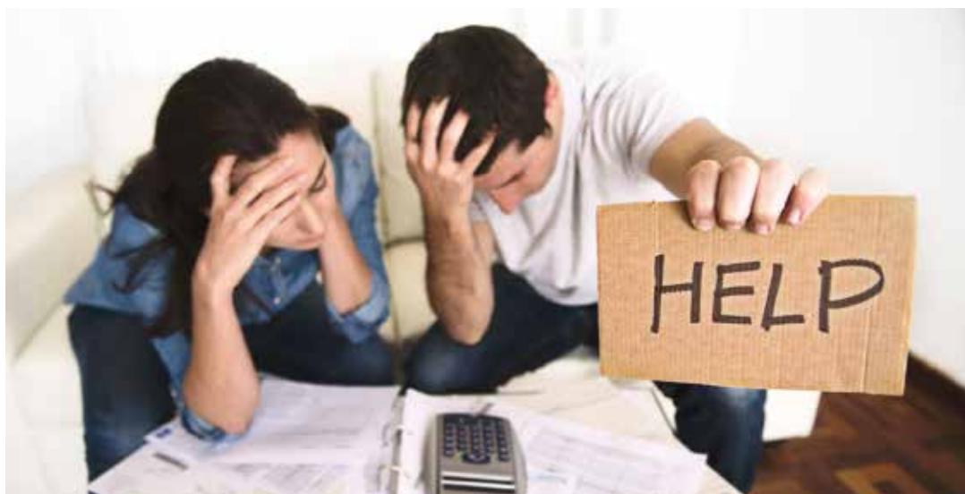
Une dépense imprévue peut mettre un foyer en grave difficulté

Pour lutter contre les précarités, le Centre Communal d'Action Sociale de la Ville a développé tout un arsenal de solutions. Parmi elles, les aides sur critères sociaux peuvent soutenir les Saint-Egrévois qui traversent une période délicate. Explications.