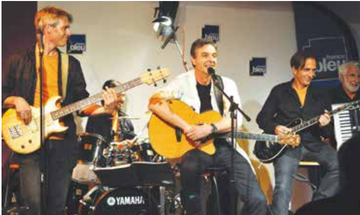
DS Club, ici en concert France Bleue, ouvre le bal!

D imanche 21 juin c'est l'été, la fête des pères et... celle de la musique! Pour la peine, les "musicos" saint-égrévois se déchainent et envahissent le Parc de l'Hôtel de Ville. Véritable retour aux sources de cette fête populaire qui donne à tous la possibilité de s'exprimer en public avec force décibels, ce sont les artistes amateurs et les associations qui tiennent donc le haut de l'affiche de cette journée sonore. En tout, et dès 15h, sept formations amateurs doivent donc se succéder sur un plateau mis à leur disposition par la Ville. C'est le DS Club et son répertoire de chansons originales qui lancent la fête, talonnés de près par le jazz vocal de l'ensemble Couleurs Jazz. Changement d'ambiance ensuite avec Saint-E Olympia qui a décidé de mettre en avant les jeunes chanteuses qui se sont révélées lors de "Moulin rouge", leur 10 e comé-