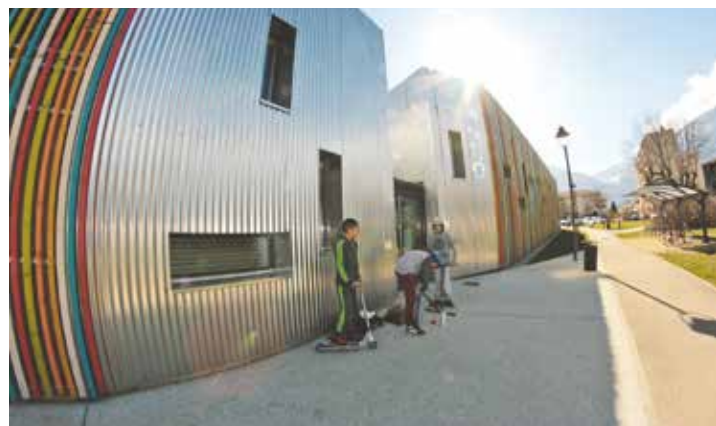
Le rendez-vous incontournable des jeunes Saint-Egrévois

250 000 € ont été consacrés par la Ville à la construction du Patio. Avec ses 600 m 2 en intérieur auxquels s'ajoutent 100 m 2 de patio extérieur, le bâtiment regroupe une salle polyvalente de 110 m 2 , une salle