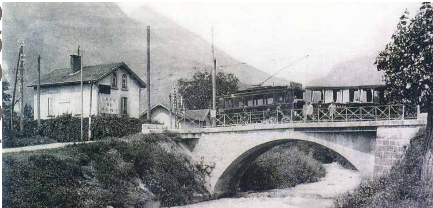
Le Pont de Vence