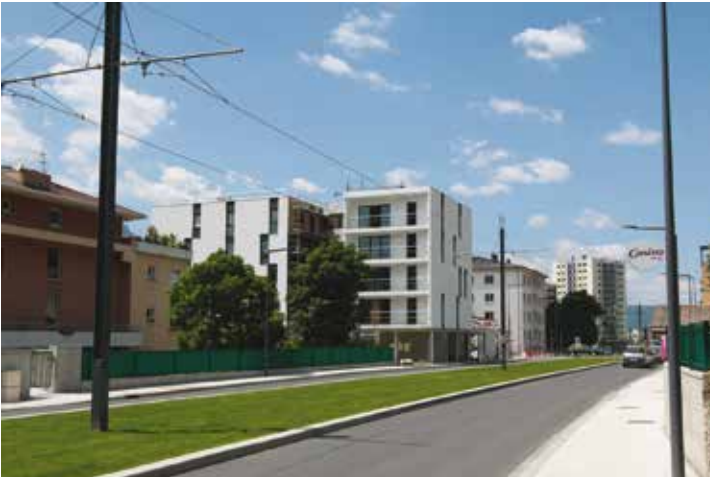
5 et de la rue de la Gare, avant et après le tram

en cours ou sont sur le point d'être lancés- accompagnent l'arrivée du tram.