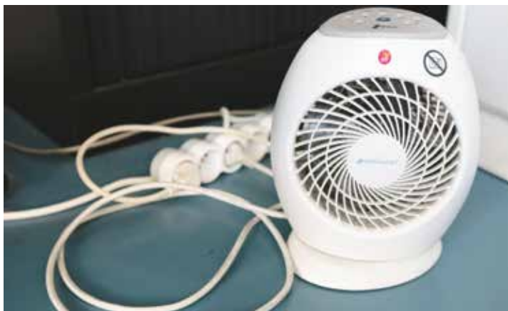
Soleni décortique les consommations énergétiques de tous les appareils électroménagers

domicile des personnes inscrites. En savoir + : 04 76 56 53 47