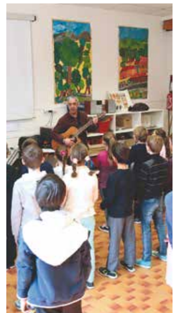
Sept enseignants de L'Unisson ont travaillé sur ce projet

D epuis plusieurs mois une cinquantaine d'élèves des classes de CMI et de CM2 de "l'école qui chante" de Barnave répète avec application un répertoire de chansons du monde. Il faut dire que la perspective de participer au spectacle professionnel "MoZaïk et invités" programmé pour le 20 juin à La Vence Scène a de quoi les motiver! Travaillant leur voix durant le temps scolaire, ces apprentis chanteurs doivent en effet rejoindre sur les planches une cinquantaine d'autres musiciens amateurs plus aguerris de L'Unisson le temps d'un concert emmené par MoZaïk. Deux sessions, une à 15h et l'autre à 20h sont prévues le 20 juin. ■ Voir aussi en page 18.