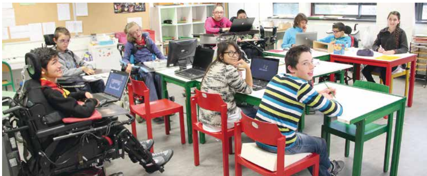
Dans la classe Geco du collège Barnave, une ambiance studieuse... ou presque