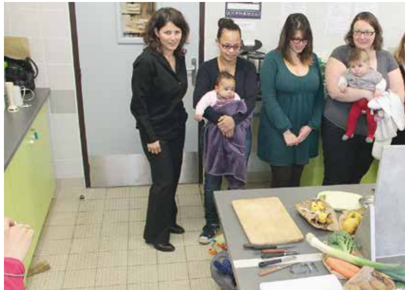
Un atelier sur la diversification alimentaire à la MSF

Le souci premier des jeunes familles est bien souvent de trouver un mode de garde qui corresponde à leur mode de vie. Et Saint-Egrève ne ménage pas ses efforts pour accompagner les jeunes parents. Entre les établissements d'accueil classiques auxquels s'ajoutent la vingtaine de professionnelles de la Crèche Familiale et la centaine d'assistantes maternelles privées qui travaillent en étroite collaboration avec le Relais Assistantes Maternelles, il y a à Saint-Egrève un grand nombre de solutions pour faire garder les moins de trois ans. Accueil Petite Enfance des Mails, crèches de la Gare et de Fiancéy, multi-accueil de Rochepleine ou de Prédieu... en tout 189 places sont proposées aux familles, ce qui représente environ le double d'enfants pouvant être accueillis dans ces