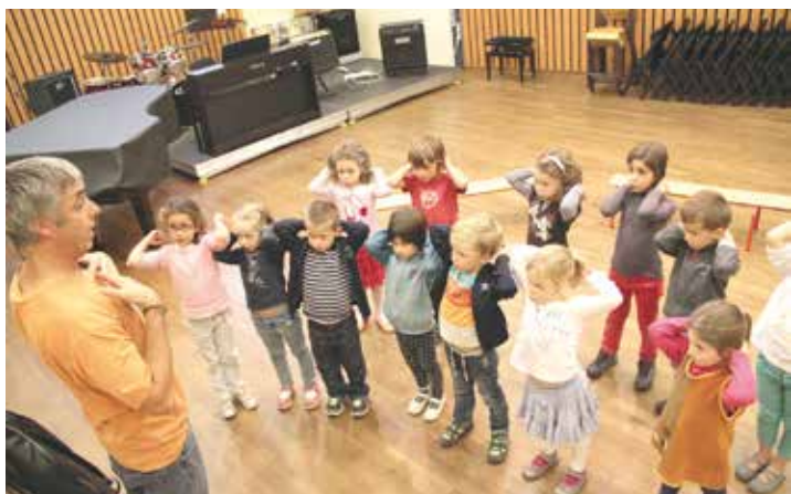
Des échauffements avant le chant

Ça marche fort. Les trois classes d'éveil musical proposées par l'Unisson affichent complet. Ouvertes en fin d'après-midi aux enfants à partir de cinq ans, elles permettent aux plus jeunes artistes de faire leurs premiers pas avant de se lancer dans les cursus musicaux mis en place par le Conservatoire à rayonnement communal de Saint-Egrève. Au programme de cette "initiation musicale, musique et chants du Monde", la découverte ludique de chants traditionnels pour enfants, des échauffements corporels, des jeux vocaux, de la danse... l'occasion de sensibiliser les petits au plaisir de la musique. ■