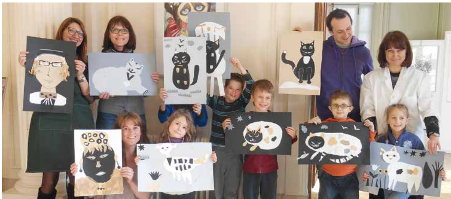
Un atelier artistique parents-enfants, l'une des nombreuses actions municipales en direction des familles

Voici plusieurs semaines, voire plusieurs mois, que les professionnels qui interviennent régulièrement dans le cadre de l'action jeunesse, et plus particulièrement les spécialistes de la famille et de la petite enfance, se mobilisent pour mettre en place les manifestations au programme de la Semaine Enfance Famille qui se déroule du 15 au 22 novembre. En partenariat avec des associations comme la MJC ou l'Association Familiale, les services de la Ville ont mis les petits plats dans les grands afin de proposer de nombreuses manifestations. Outre la journée festive du 15 novembre qui traditionnellement rassemble plusieurs centaines d'enfants et de