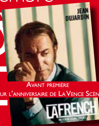
AVANT PREMIÈRE POUR L'ANNIVERSAIRE DE LA VENCE SCÈNE