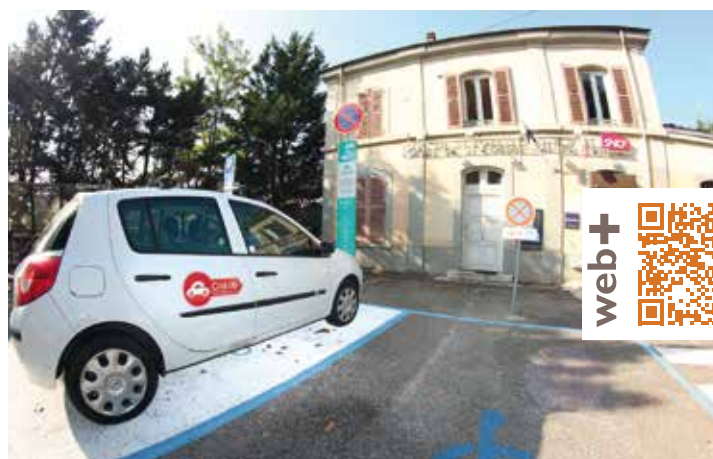
La nouvelle place de Cité lib

En octobre, une place réservée au stationnement d'une voiture autopartage a été installée au niveau de la gare SNCF de la Ville. Emplacement stratégique qui permet à des personnes utilisant le train de faire la jonction avec ce moyen de transport original, il a été réalisé avec le concours du Centre Technique de la Ville. A noter : cette voiture était jusqu'alors stationnée dans le quartier de Fiancéy mais les