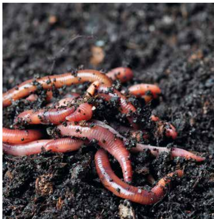
Des invités dans la cuisine...

Information et réservation (obligatoire) : 04 76 34 74 85 ou trieve-compostage@hotmail.com