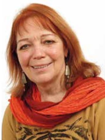
Adjointe en charge des solidarités entre les âges de la vie