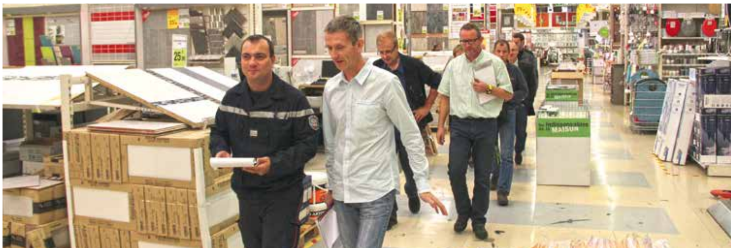
Une visite de sécurité à Leroy-Merlin

Les deux derniers mois se sont déroulés sur un rythme de marathon pour les pompiers, les gendarmes et les services municipaux chargés de la sécurité incendie dans les établissements recevant du public. En effet, pas moins d'une vingtaine de magasins ont été minutieusement inspectés par des professionnels emmenés par les soldats du feu afin de s'assurer que leur ouverture au public peut se faire dans les meilleures conditions de sécurité possibles. Ces inspections