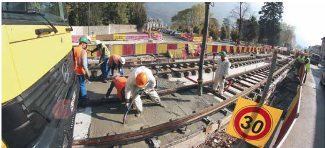
Pose des rails au niveau de l'Hôtel de Ville

Un train d'enfer ! C'est le rythme auquel travaillent les ouvriers de la ligne E du Tram sur Saint-Egrève. Et ça se voit. Les rails sont déjà posés depuis Karben jusqu'à la Mairie, et en passe de l'être du côté de Fiancey. Partout, "les déviations de réseaux sont terminées et les efforts peuvent désormais se concentrer sur le début des travaux d'espaces verts et de revêtement de plateforme" indiquait les représentants du SMTC lors du dernier comité de coordination de chantier durant lequel il a aussi été souligné que les travaux de signalisation lumineuse tricolore étaient lancés et que les restitutions aux riverains avaient commencé. Dans les trois mois qui viennent la mise en place des feux de signalisation va continuer, les mats des lignes aériennes de contacts qui permettent d'alimenter le tram en électricité seront érigés et armés, les sous-