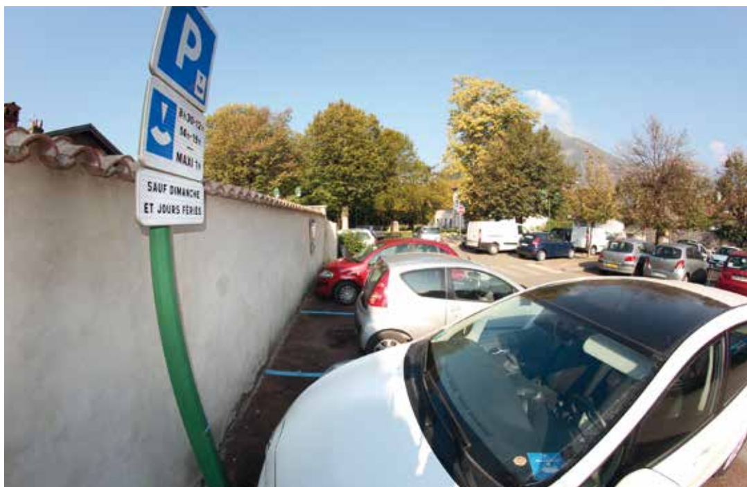
Les stationnements en zone bleue à Saint-Robert

Le long de l'axe du tram actuellement en construction, 124 places de parking sont aménagées ou sur le point de l'être par le Syndicat Mixte des Transports en Commun. Pour fluidifier la circulation de tous et éviter de faire de la RD 1075 un parking relais qui serait monopolisé par des utilisateurs du tramway allant travailler à Grenoble, il a été décidé que l'ensemble de ces places serait transformé en zone bleue au plus tard à la mise en fonction de la ligne E. Les places ayant