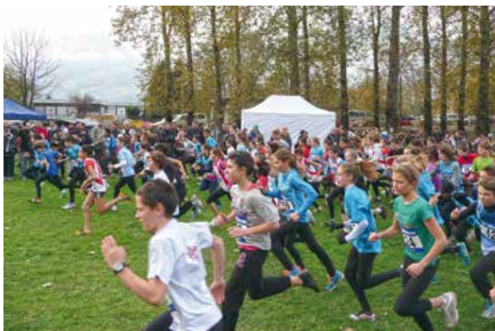
Un cross très prisé

Toutefois, si les 13 courses mises en place pour l'occasion s'adressent plutôt à des sportifs entraînés et qui sont en bonne condition physique, l'une d'entre-elles est plus particulièrement accessible aux coureurs occasionnels, voire aux débutants complets. En effet, pour la seconde année consécutive,