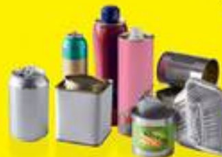
TOUS LES EMBALLAGES MÉTALLIQUES