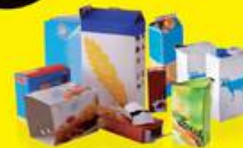
TOUS LES CARTONS ET BRIQUES ALIMENTAIRES