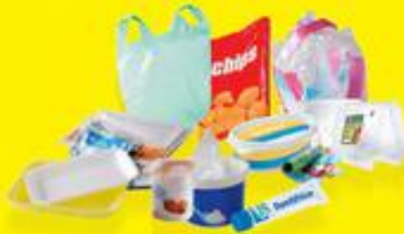
TOUS LES POTS, BARQUETTES ET FILMS EN PLASTIQUE