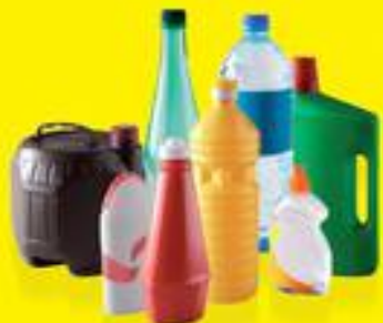
TOUS LES FLAONS ET BOUTEILLES EN PLASTIQUE