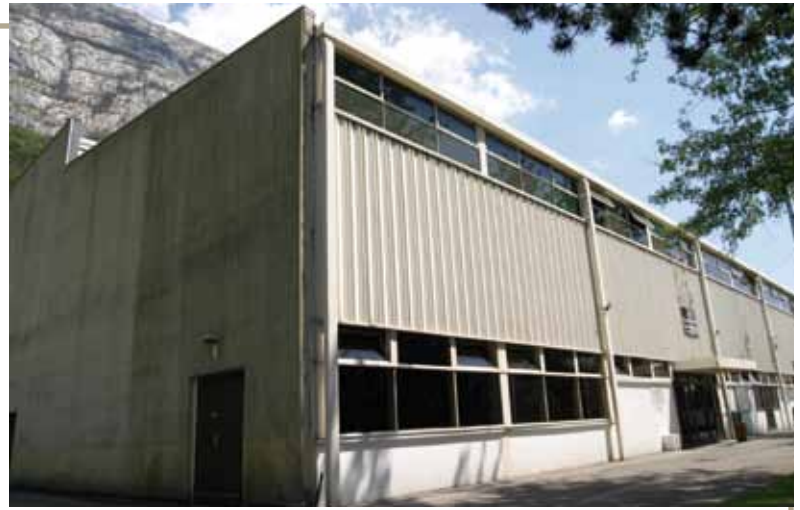
La Halle Jean Balestas aujourd'hui...